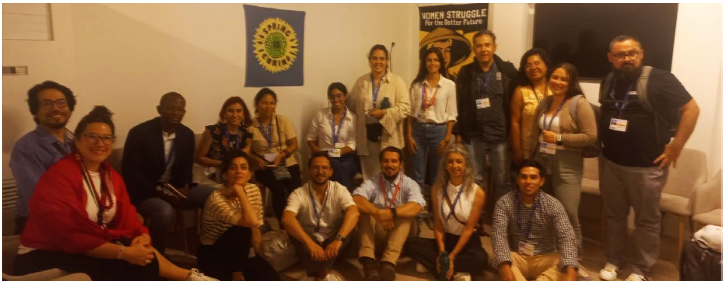
Sesión estratégica de Pérdidas y Daños