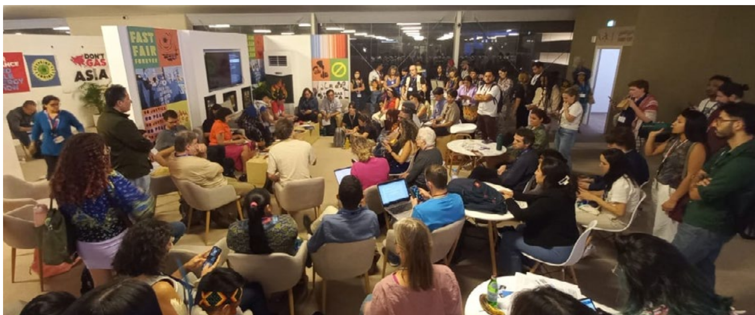
Asamblea de Organizaciones de Sociedad Civil de América Latina y el Caribe en la COP28