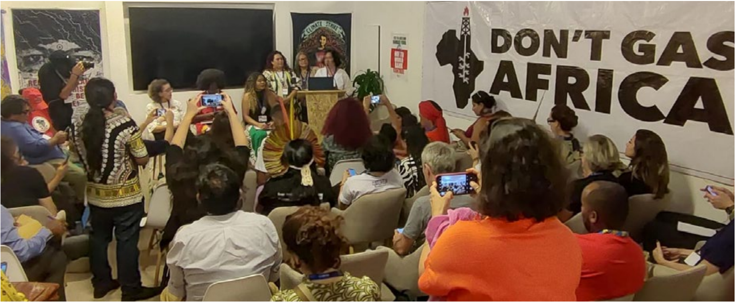
Lanzamiento de la cupula dos povos, cumbre de los pueblos COP30 en Brasil 2025