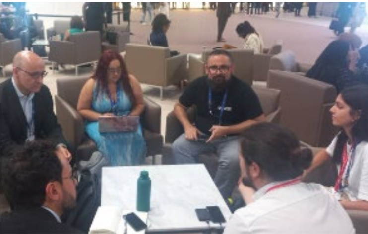
Bilateral con Chile