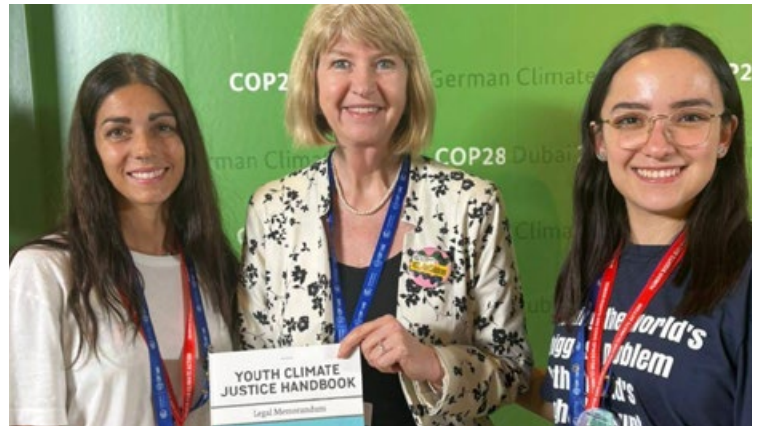
Jóvenes presentan argumentaciones para la Opinión Consultiva a la CIJ al Relator Especial sobre los derechos de los pueblos indígenas y al Comité de los derechos del Niño de Naciones Unidas