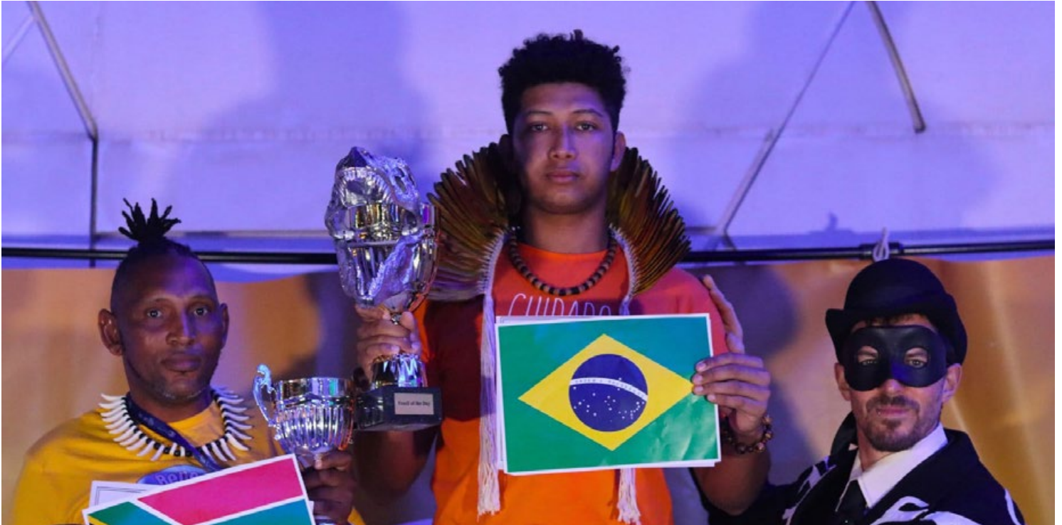
El premio del #FossiloftheDay del 05 de diciembre fue para Brasil por su anuncio en la COP28 de ir por más petróleo