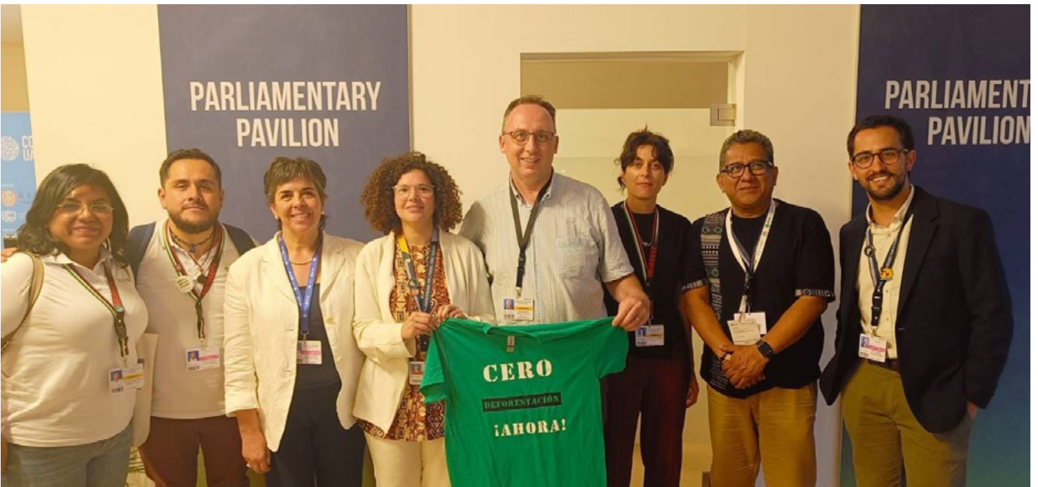
Encuentro de Canla con la red parlamentaria para un Mundo Libre de Combustibles Fósiles