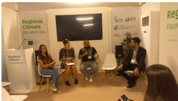
Primera Conferencia de Prensa de CANLA en la #COP28