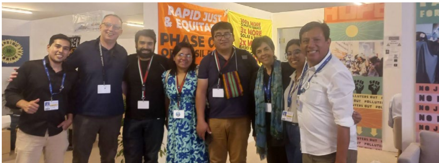
Bilateral con Bolivia