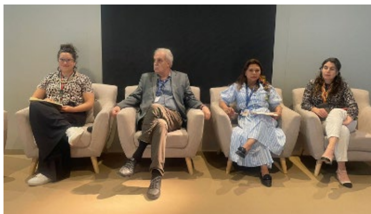
Diálogo Amazonia rumbo a la COP30